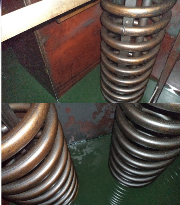
Bilder der „Paivi“ mit Xbee: