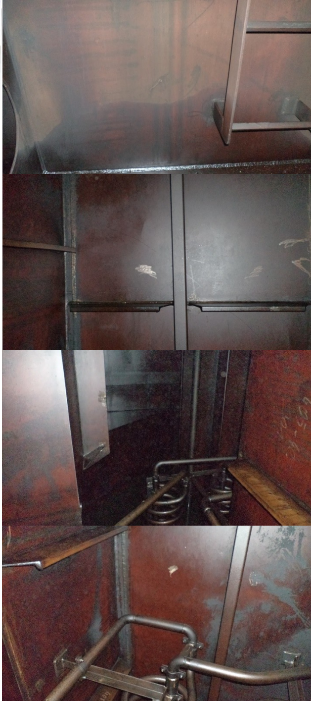
Bilder der „Paivi“ mit Xbee: